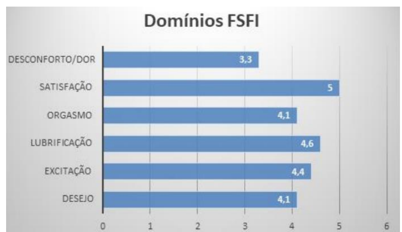
Gráfico 1: escores médios para os domínios específicos do FSFI. A dor genital foi o domínio mais afetado.

Quanto à disfunção sexual, 57% da amostra apresentou escores compatíveis com o problema. Quando analisadas as médias dos domínios isoladas, o domínio que apresentou menor pontuação foi o domínio dor, seguido de desejo e orgasmo, excitação e lubrificação, apontando que a disfunção que prevalece entre esse grupo, é a dolorosa (gráfico 1).