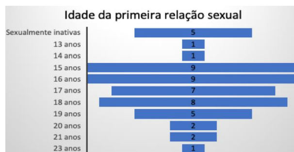
Gráfico 1: Idade da primeira relação sexual

As questões subjetivas relacionadas ao assoalho pélvico e autoconhecimento tabela 2.